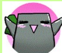
下仁田高校マスコット 「ネギゴン」

甘楽郡下仁田町下 仁田550-1 TEL 0274-82-3124 FAX 0274-82-2488 https://shimonita-h s.gsn.ed.jp