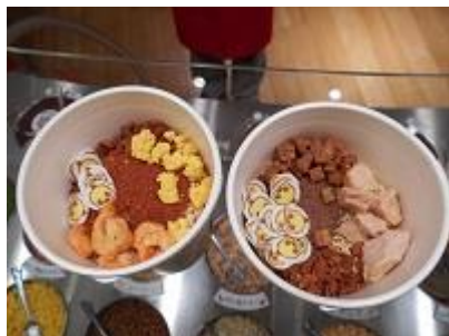
オリジナルカップヌードル