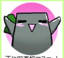
下仁田高校マスコット「ネギゴン」

甘楽郡下仁田町下仁田550-1 TEL 0274-82-3124 FAX 0274-82-2488 http://www.nc.shimonia-hs.gsn.ed.jp