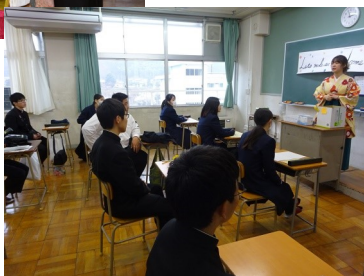
最後のホームルーム

3月2日、第71回卒業証書授与式が挙行されました。式の規模は縮小となりましたが、卒業生の表情は晴れやかで、一人ひとり堂々と証書を受け取っていました。下仁田高校で過ごした3年間の思い出を胸に、社会へと大きく羽ばたいてほしいと思います。ご卒業おめでとうございます。